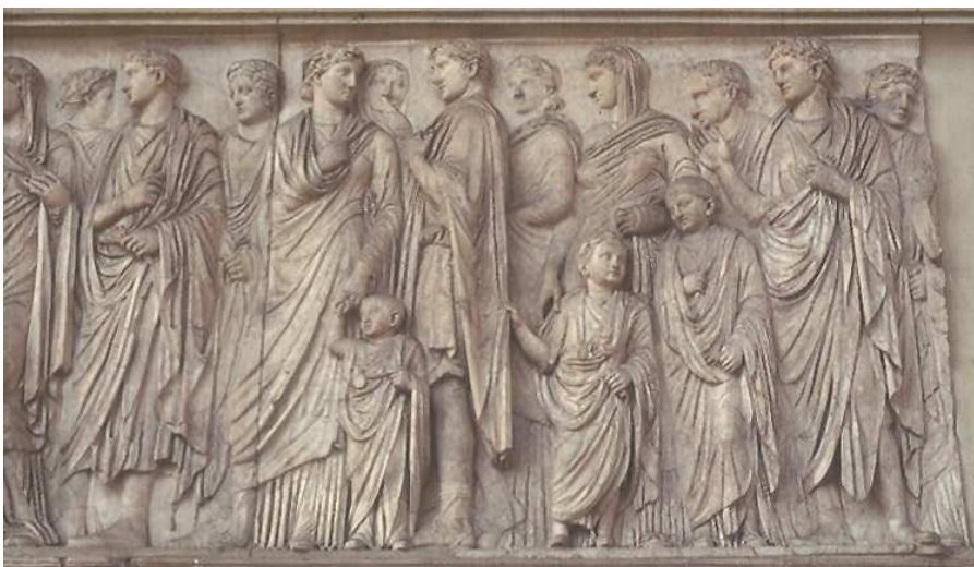
Imagen 3. Ara Pacis Augustae. Procesión en el lado sur. Siglo I a.C.

Imatge 3. Ara Pacis Augustae. Processó del costat sud. Segle I a.C.