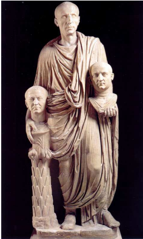
Imagen 1: Imagines maiorum . Brutus Barberini Siglo I a.C.

Imatge 1: Brutus Barberini, Imagines maiorum . Segle I a.C.