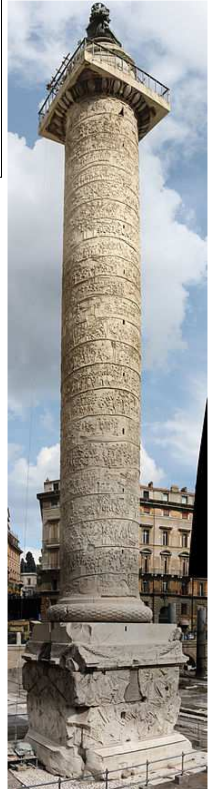
Imagen 2: Columna de Trajano. Siglo II d.C.

Imatge 2: Columna de Traianus. Segle II d.C.